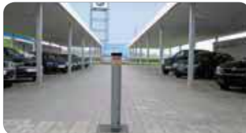
Installation avec Coral