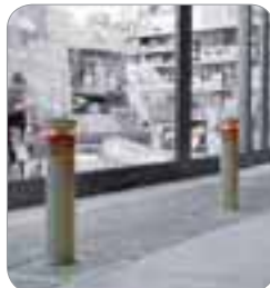
Installation avec Coral, version avec led