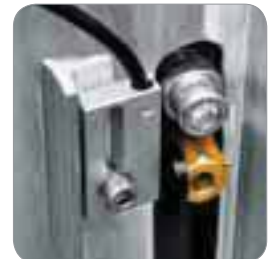
Fin de course magnétique