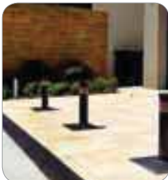
Installation avec Coral

Le programmeur électronique ELPRO S40 gère jusqu'à quatre bornes escamotables en même temps.